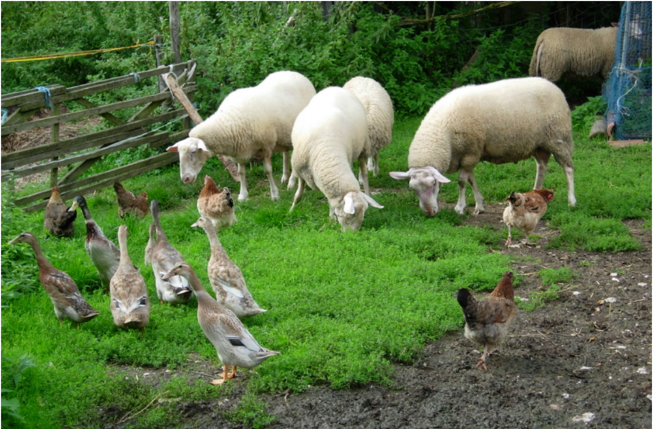
Foto de permakultura bieno.