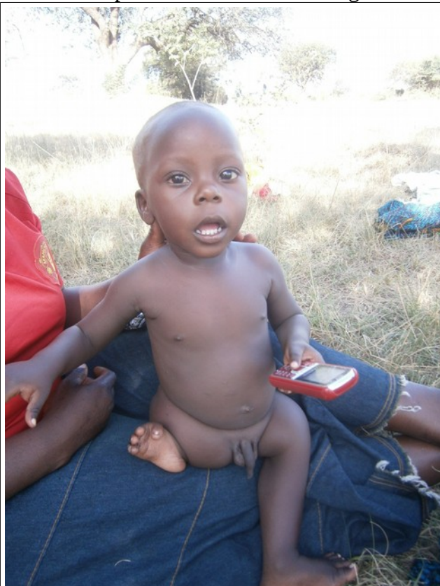
knabo kun reduktita gambo – kial – kio eblas ?